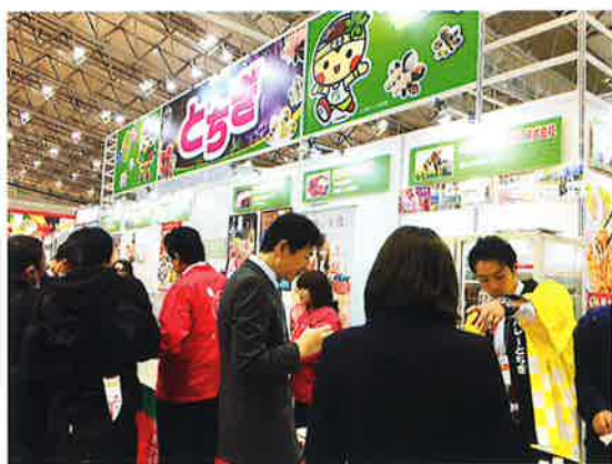
スーパーマーケット・トレードショー