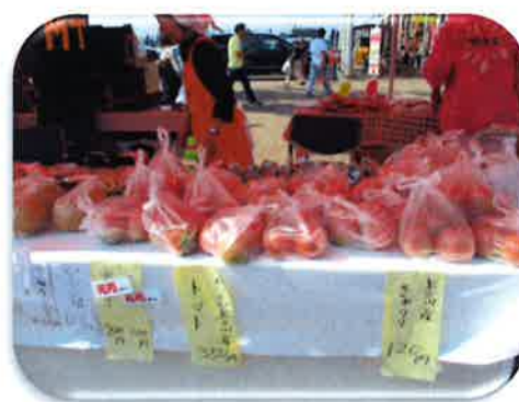
上三川町加工組合「ゆうがお」

※次ページ以降にEマーク商品の説明、会員名簿と取扱商品の一覧表を添付してありますので、ご覧ください。