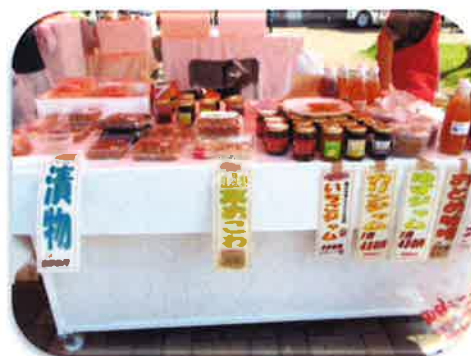
西方町加工組合「おとめ会」